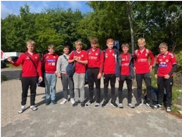
Kåsen klar i Danmark