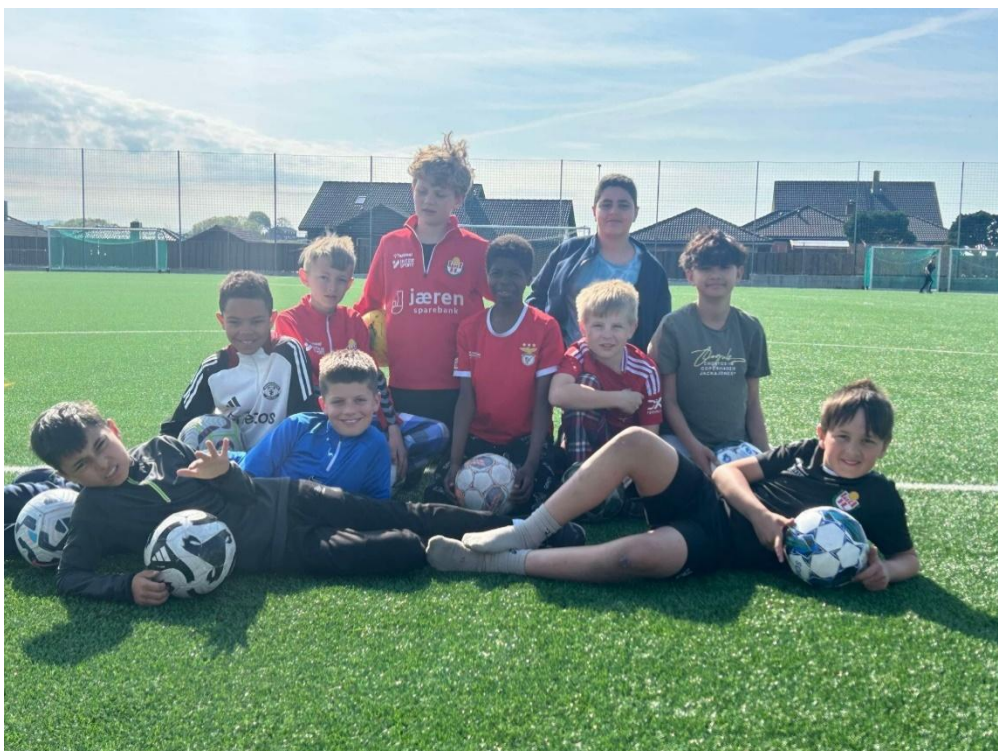
Gjengen på Teambuilding på Kåsen