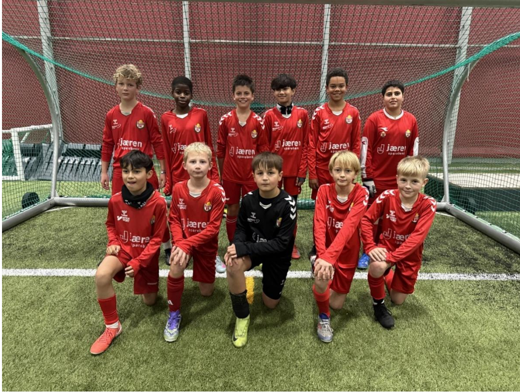
Bilde etter siste 7er kamp