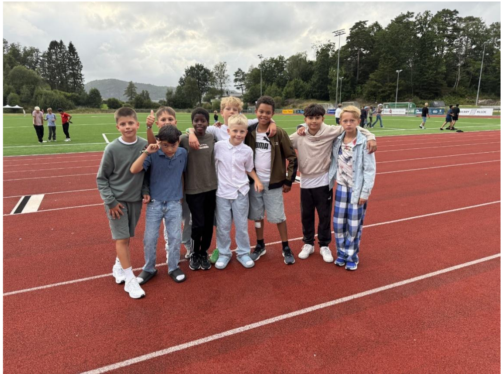
Klar for disco i Lyngdal