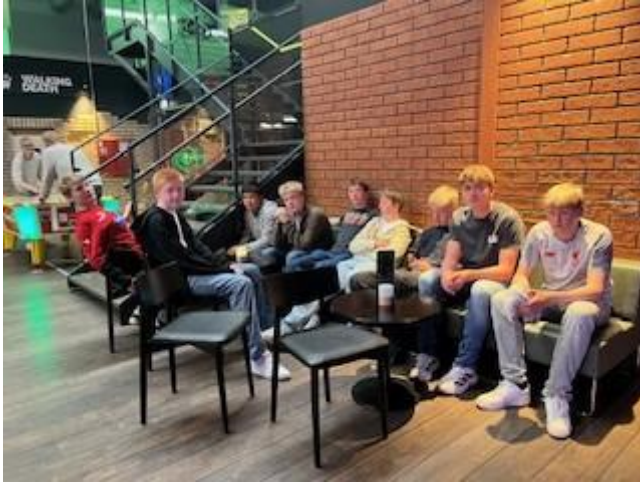
Lasertag, minigolf og sosialt